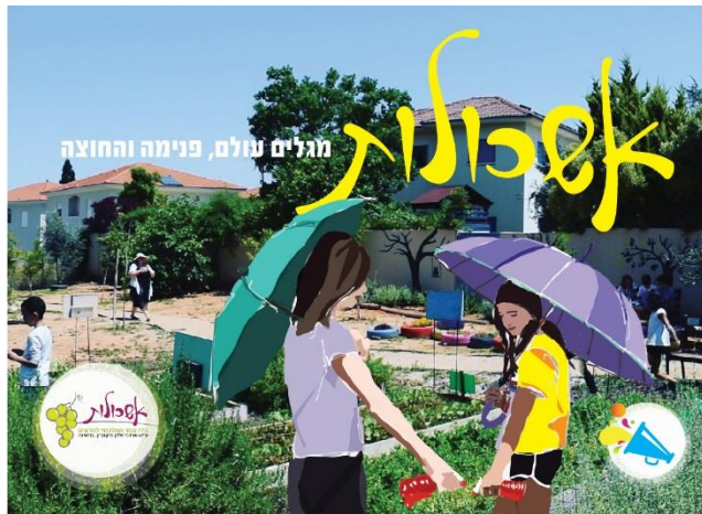
מגלים עולם פנימה והחוצה