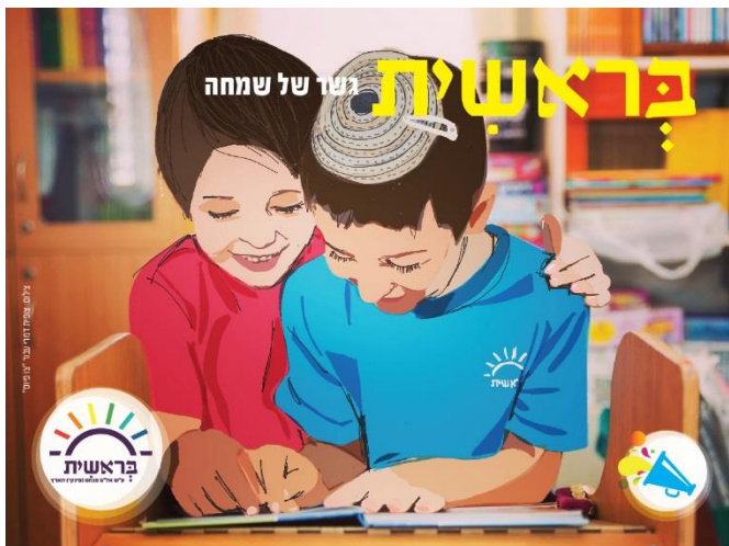
למידה דיאלוגית ברוח בי"ס המשלב