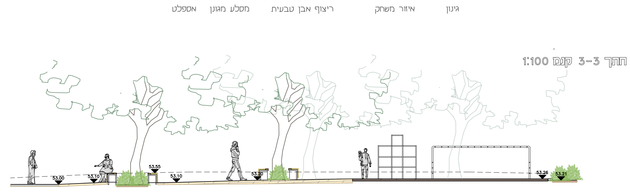
חתך 3-3 קנימ 1:100