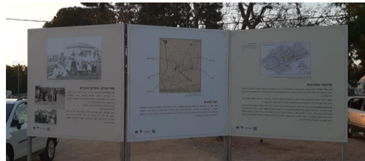
תערוכת רחוב להצגת התכנית אוגוסט-ספטמבר, 2019