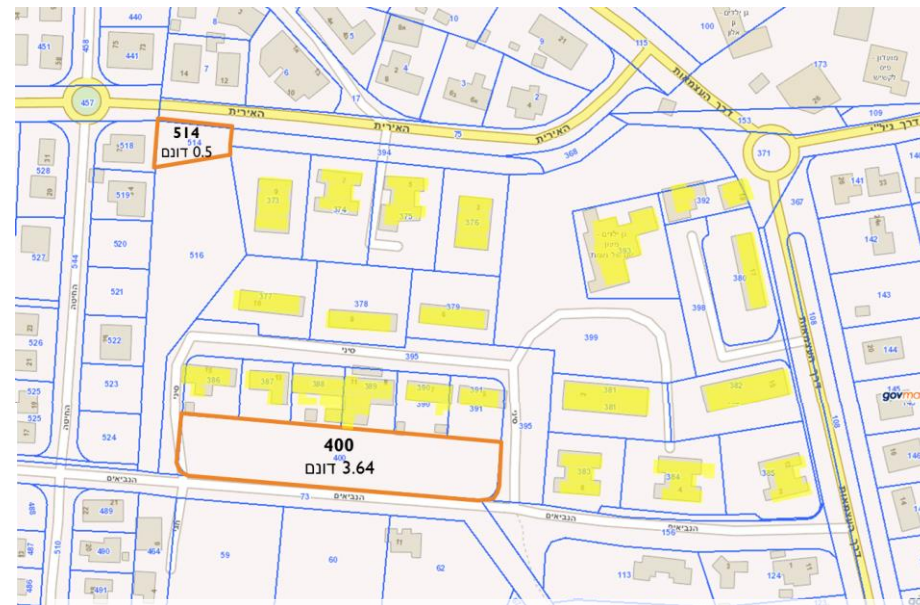
1. מגרשים להשלמת כלכליות בתחום התכנית