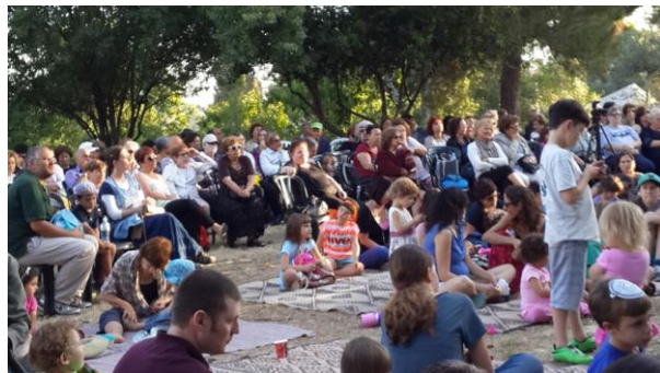
מפגש ציבורי בגינת השכונה ספטמבר 2019