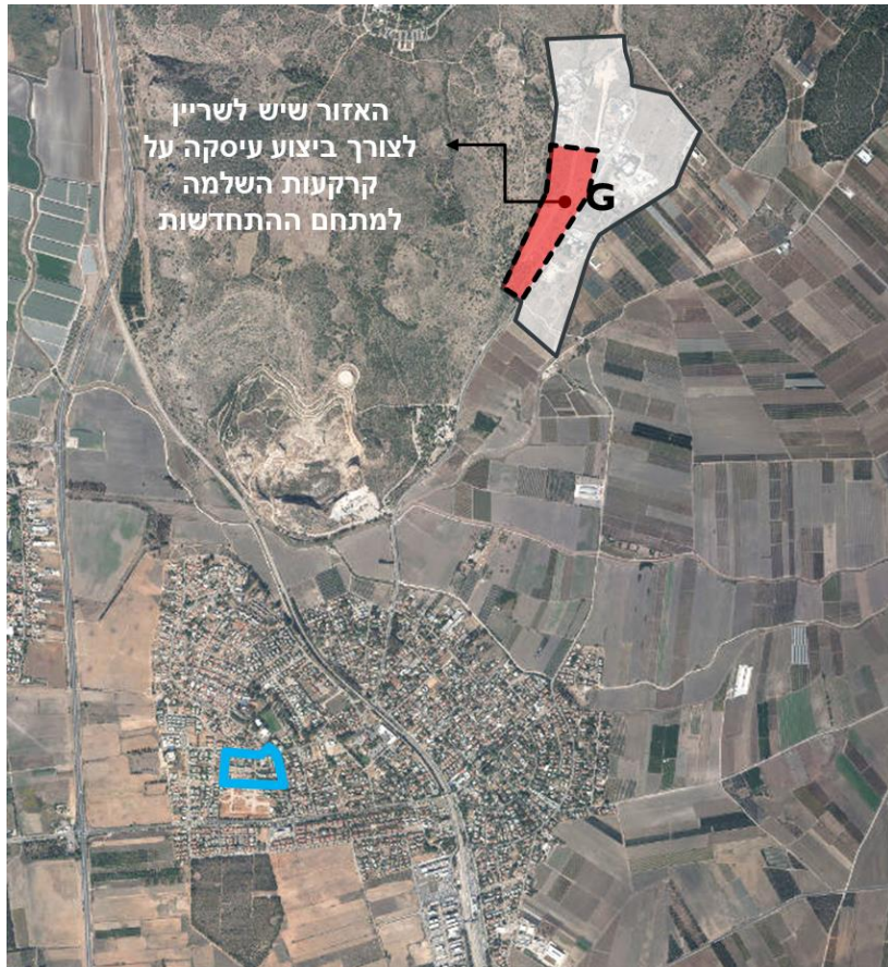
2. מגרשים להשלמת כלכליות מחוץ לתכנית